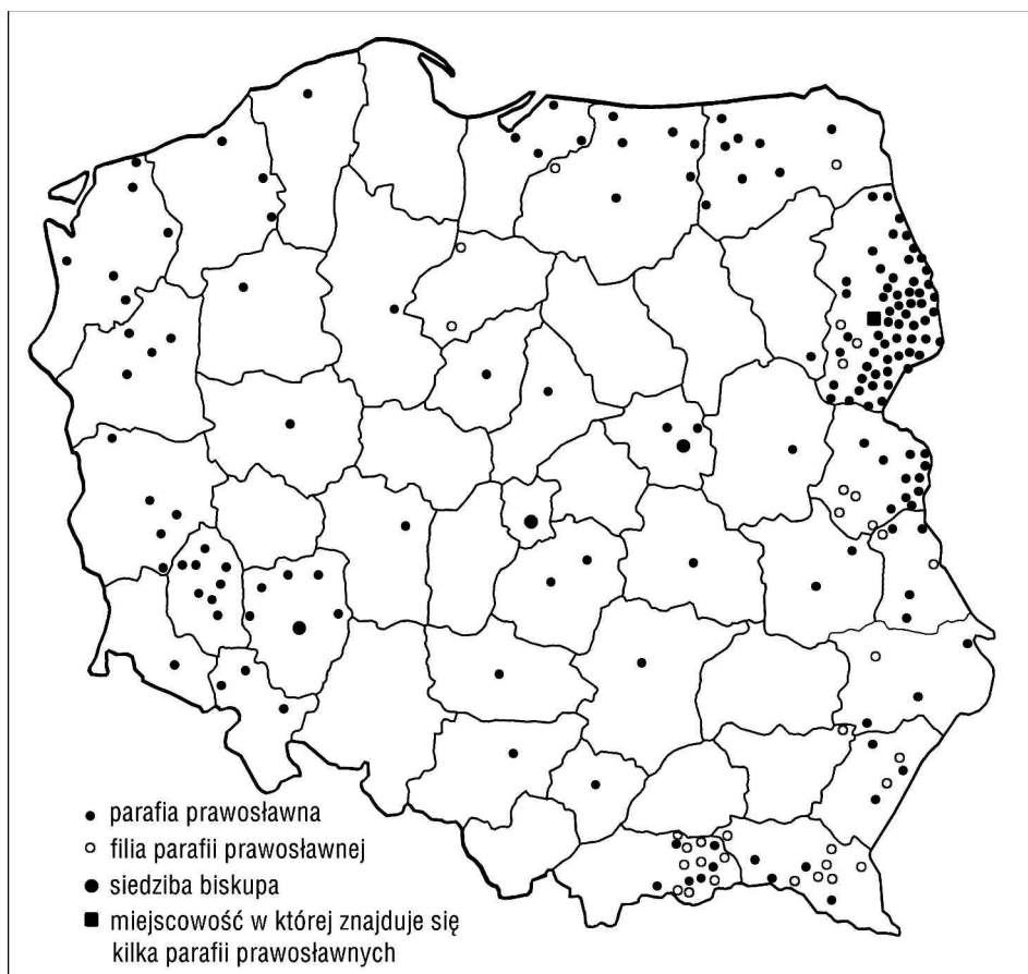
Ryc. 1. Rozmieszczenie parafii prawosławnych w Polsce.

bielskiej oraz pięciu diecezji: białostocko-gdańskiej, lubelsko-chełmskiej, przemysko-nowosądeckiej, łódzko-poznańskiej i wrocławsko-szczecińskiej. Każda z diecezji składa się z dekanatów, w skład których wchodzi parafie wraz z filiami. W Polsce jest ponad 240 parafii, nieco ponad 300 prawosławnych obiektów sakralnych (cerkwi i kaplic). Funkcjonuje sześć klasztorów prawosławnych - trzy męskie i trzy żeńskie. Cztery spośród nich wznowiły swoją pracę lub powstały w ostatnim okresie. Od czasu II wojny światowej do lat 80. istniały jedynie klasztory w Jabłecznej i na „Świętej Górze” k/Grabarki. Męskie klasztory znajdują się w Jabłecznej, Supraślu i Ujkwicach k/Żurawicy. Dwa pierwsze mają starą metrykę, ostatni zaś powstał zupełnie