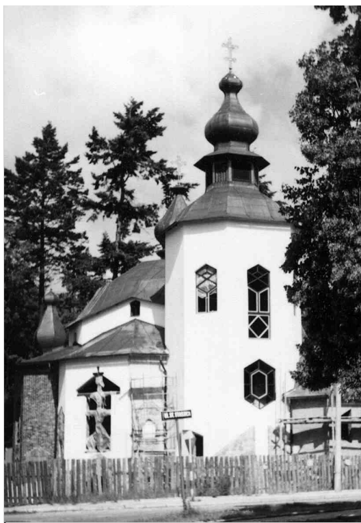
Cerkiew w Giżycku.

Inny charakter aniżeli Białostocczyzna posiadają obszary położone na południe od środkowego Bugu, poczynając od południowego Podlasia, poprzez Chełmszczy-