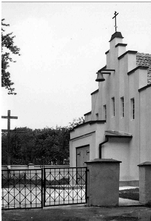
Cerkiew w Giżycku.

miejsowości istnieje zazwyczaj jedna świątynia - albo katolicka, albo prawosławna. Jedynie większe miejscowości posiadają i kościół i cerkiew jednocześnie.