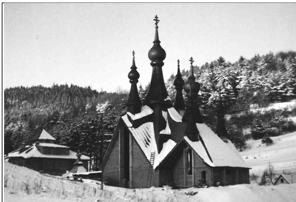
Cerkiew w Krynicy.

Boskiej. Uczestniczą w nich wierni z okolicznych parafii. Ostatnimi czasy na uroczystości lipcowe zjeżdżają także Łemkowie - szczególnie młodzież - z całej Polski.