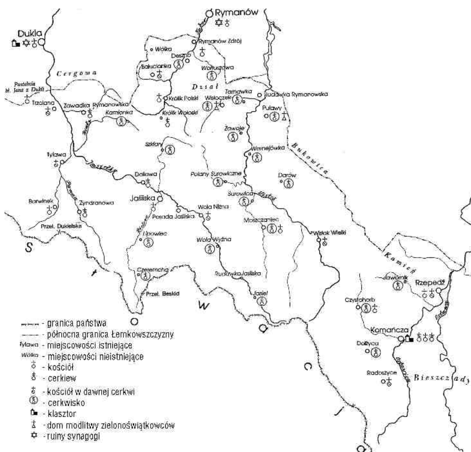
Ryc. 2. Obiekty sakralne we wschodniej części Beskidu Niskiego.

razem dwóch sięgających starożytności tradycji: łacińskiej, zracjonalizowanej i trzeźwej myśli Zachodu, i bizantyjskiej, skłonnej do mistyki i kontemplacji tradycji chrześcijańskiego Wschodu” 24 . Granice wyznaniowe pokrywały się wtedy z granicami etnicznymi. Polacy byli wiernymi obrządku rzymskokatolickiego, a przybyli z kolejną falą osadniczą Rusini byli wyznawcami prawosławia.