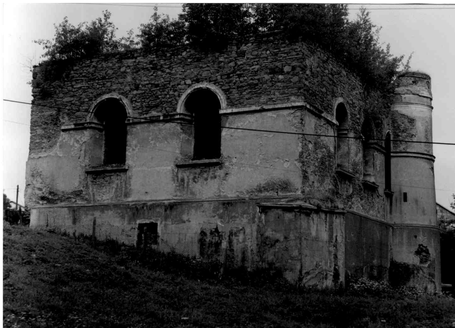
Ruiny synagogi w Rymanowie (fot. M. Świrad).

czona na wschodniej ścianie (mizrach) tablica lub inny symbol. Na tej ścianie znajduje się zamknięta i okryta zasłoną (parochet) nisza Aron ha-kodesz (Święta Arka). Przechowuje się w niej zwoje ręcznie przepisywanego na pergaminie Pięcioksięgu. Na środku znajduje się podwyższenie - bima, z której odczytuje się fragmenty Tory i głosi naukę 42 . Najstarsze wzmianki o Żydach na Podkarpaciu pochodzą z poł. XIV w. i dotyczą Sanoka. W Rymanowie po raz pierwszy o obecności Żydów dowiadujemy się w 1567 r. W rejestrach podatkowych jest mowa o siedmiu rodzinach izraelskich 43 . Mieli tutaj swoją gminę wyznaniową, synagogę i kirkut (cmentarz). W XVII w. zdominowali handel w Rymanowie, głównie winem przywożonym z Węgier. Ponadto handlowali pieprzem, rodzynekami, szafranem i imbirem. Zajmowali się także lichwą 44 . W 1765 r. tutejsza gmina izraelska liczyła 1015 Żydów, co stanowiło 42,8% całej ludności Rymanowa 45 . Na przełomie XVIII i XIX w. Rymanów stał się ważnym ośrodkiem myśli i nauki chasydzkiej. Stało się to za sprawą słynnego cadyka Menachema Mendla oraz jego ucznia i następcy Cwi Hirsza 46 . W 1886 r. miasto liczyło 3 262 mieszkańców, w tym 1 391 Żydów (42,6 %).