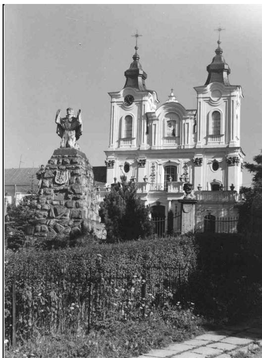
Kościół przy klasztorze OO. Bernardynów w Dukli.

W Dukli i Rymanowie znajdują się kościoły murowane. Świątynia w Rymanowie zbudowana została w latach 1779-1781 w stylu późnego baroku, natomiast w Dukli znajdują się dwa kościoły rzymskokatolickie: parafialny z lat 1764-1765 i bernardynów z 1775 r. w stylu barokowym fundacji Wandalina Mniszcha, ówczes-