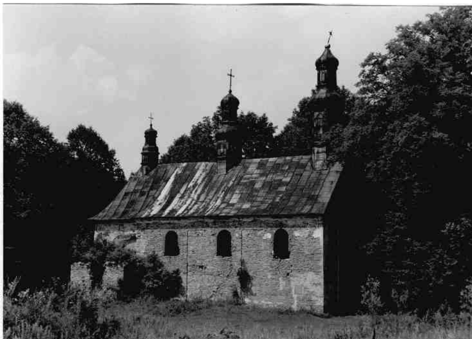
Cerkiew w Króliku Wołoskim.

Murowanymi cerkwiemi są świątynie w Tylawie (data budowy - 1787 r., w 1879 r. została powiększona o wieżę) oraz w Trzcianie (1811-1814). R. Brykowski 38 zalicza je, razem z budowlami drewnianymi, do cerkwi typu powszechnego, schyłkowego (wariant polski). Ściany wszystkich podstawowych części cerkwi są jednakowej wysokości i przykryte są osobnymi dachami. W zewnętrznej bryle dominuje, podobnie jak w większości cerkwi typu „północnego”, wieża posadowiona nad babińcem.