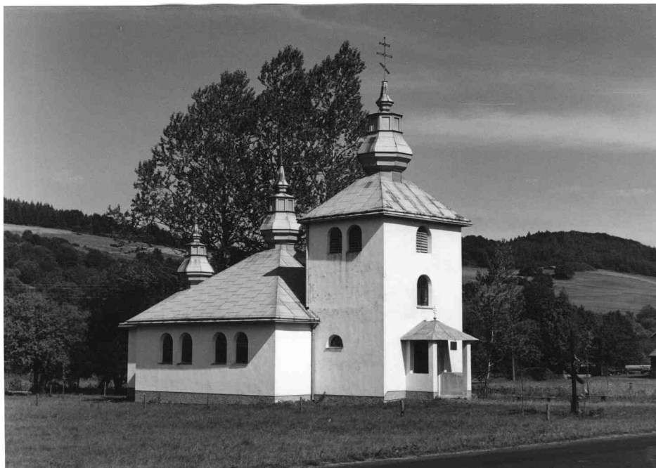
Cerkiew w Zyndranowej.

W Lipowcu na północnych stokach Karpat istniała cerkiew (powstała na początku XVIII w.) reprezentująca typ określany mianem południowego, charakterystyczny dla terenów obecnej wschodniej Słowacji. Był to jedyny po polskiej stronie przykład „klasycznej”, stylowo czystej cerkwi łemkowskiej.