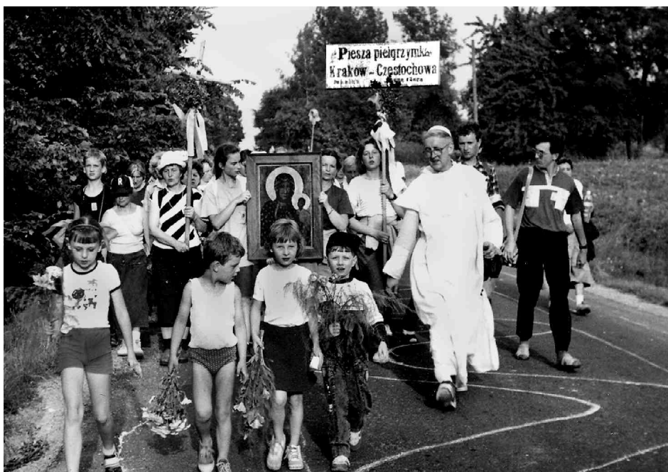
W drodze na Jasną Górę

grzymi ludzi trwających w postawie sprzeciwu wobec Chrystusa. “Świętą Maryję, błogosławioną między niewiastami” , błagają o świętość, która jest powołaniem każdego chrześcijanina, wyróżnionego łaską Bożego Synostwa. Uczą się równocześnie radować bardziej z Bożego wybrania niż smucić się z powodu własnych grzechów i dlatego mimo doświadczonej słabości stają się zdolni do radości i nadziei.