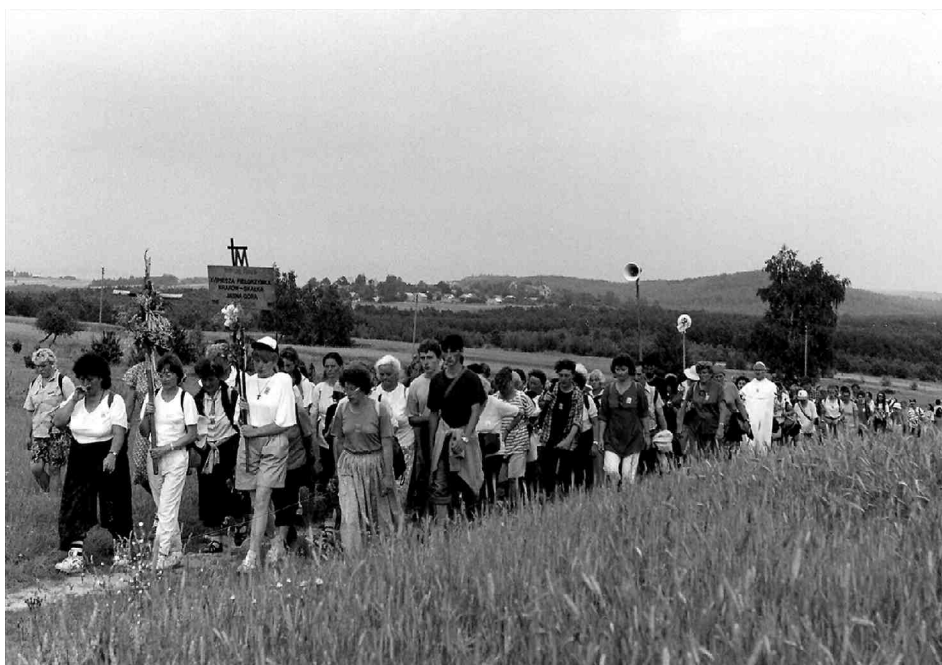
W drodze na Jasną Górę

W 1992 r. wprowadzono jako przygotowanie do liturgii eucharystycznej w następnym dniu medytację biblijną nad tekstami liturgicznymi.