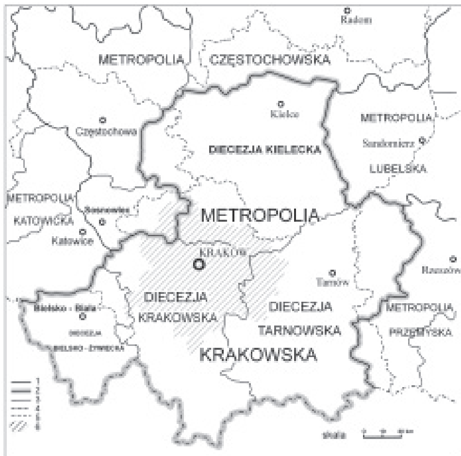
Ryc. 2. Metropolia Krakowska

1 – granice metropolii po 1992 r., 2 – granice metropolii krakowskiej po 1992 r., 3 – granice diecezji po 1992 r., 4 – granica państwa, 5 – granice województw po 1999 r., 6 – Krakowski Obszar Metropolitalny (KOM).