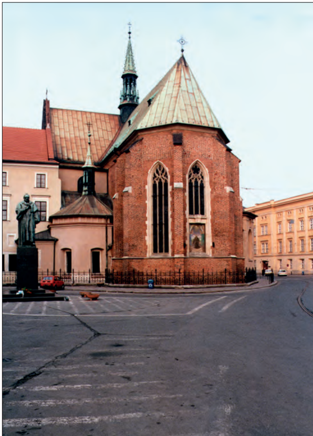
Fot. 1. Bazylika oo. franciszkanów w Krakowie