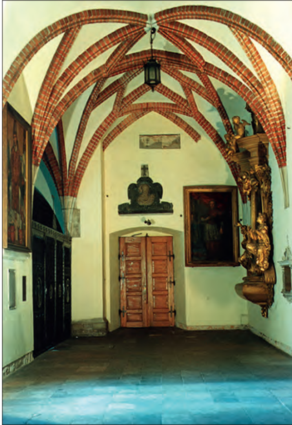
Fot. 3. Sklepienie w nawie głównej bazyliki oo. franciszkanów w Krakowie