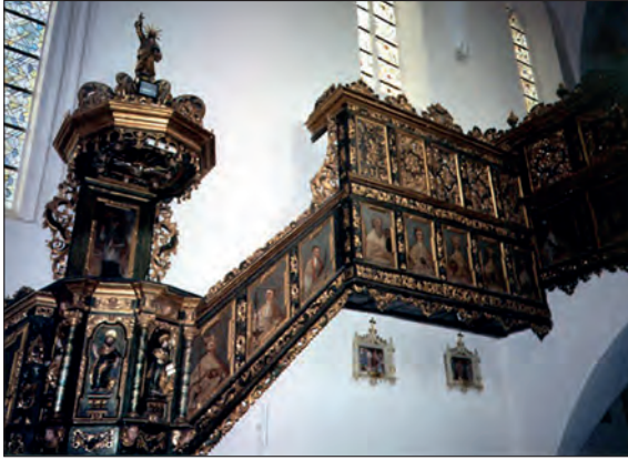
Fot. 9. Ambona, drewniane schody