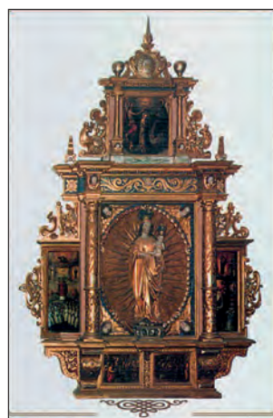
Fot. 8. Ołtarz Świętej Rodziny z późnogotycką rzeźbą Madonny z Dzieciątkiem