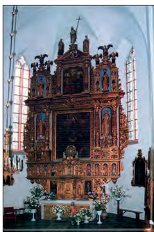
Fot. 6. Ołtarz główny