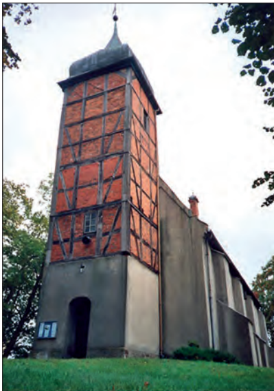
Fot. 11. Kościół św. Jana Chrzciciela