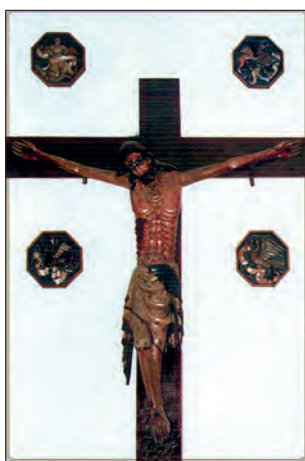
Fot. 7. Gotycki krucyfiks