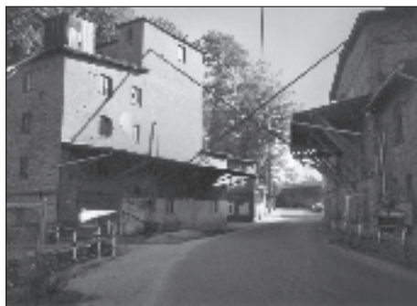
Fot. 2. Papiernia (obecnie młyn) w dolinie Słupiny. Widoczna żelbetowa konstrukcja – przerzut wody nad drogą

W dolnej części doliny Słupiny funkcjonował też tartak i kuźnia. Tartak odnotowano w źródłach pisanych w 1748 i 1772 r. Kuźnia, zwana hamrem, istniała (poniżej papierni) w dolinie Słupiny już w XVI w. Obiekt zniszczono podczas budowy magistrali kolejowej 23 . Przy obiektach przemysłowych znajdowały się