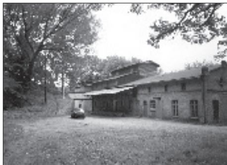
Fot. 1. Młyn i elewator nad Radunią

Na południe od Raduni znajdowało się jedynie wzgórze cmentarne, na którym w 1754 r. wybudowano kaplicę cmentarną św. Nepomucena upamiętniającą śmierć zakonnic wymordowanych podczas najazdu Prusów w 1234 r. Kaplica ta przetrwała do dnia dzisiejszego.