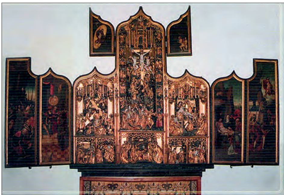
Fot. 5. Tryptyk Antwerpski