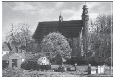
Fot. 3. Sylweta ponorbertańskiego kościoła Wniebowzięcia NMP.

Jednonawowy, siedmioprzęsłowy kościół zbudowany jest na rzucie wydłużonego prostokąta z trójbocznie zamkniętym, nie wydzielonym prezbiterium.