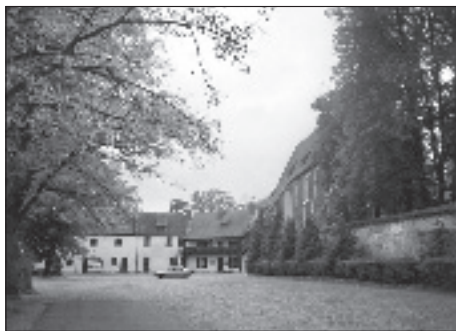
Fot. 4. Wnętrze krajobrazowe w obrębie zabudowań poklasztornych. Widoczna bryła kościoła z fragmentem muru obwiedniego, dziewiętnastowieczna plebania i fragment czternastowiecznego budynku gospodarczego