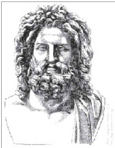
Fot. 8. Bóg starożytnych Greków – Zeus

U starożytnych Greków kult rzek istniał jeszcze przed inwazją indoeuropejską. Ślady tego kultu przetrwały do schyłku hellenizmu. Mitologia akwaticzna Greków była bardzo bogata. Najbardziej znany był bóg rzeczny Acheloos; jego imię interpretowano bardzo różnie; najbardziej prawdopodobna etymologia wskazuje na znaczenie „woda” (fot. 7). Wśród Hellenów panowało powszechne