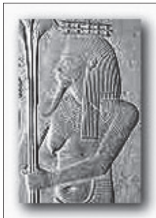
Fot. 10. Bóg Hapi (wg wierzeń egipskich Nil wylewał za sprawą boga Hapi, który dostarczał wodę z bezdennego dzbana

W starożytnym Egipcie Nil uznawany był od tysiącleci za boski, bowiem jego wylewy zapewniały trzykrotne w ciągu roku zbiory zbóż (fot. 9). Przybory Nilu regulował bóg Hapi na wyspie File w pobliżu pierwszej katarakty przy Asuanie, która zamykała drogę wodną do Egiptu plemionom nubijskim z południa (fot. 10, 11). Efekt świętości rzeki był wzmocniony, gdyż Nil nie tylko żywił,