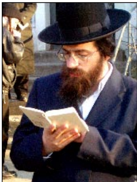
Modlitwa chasyda