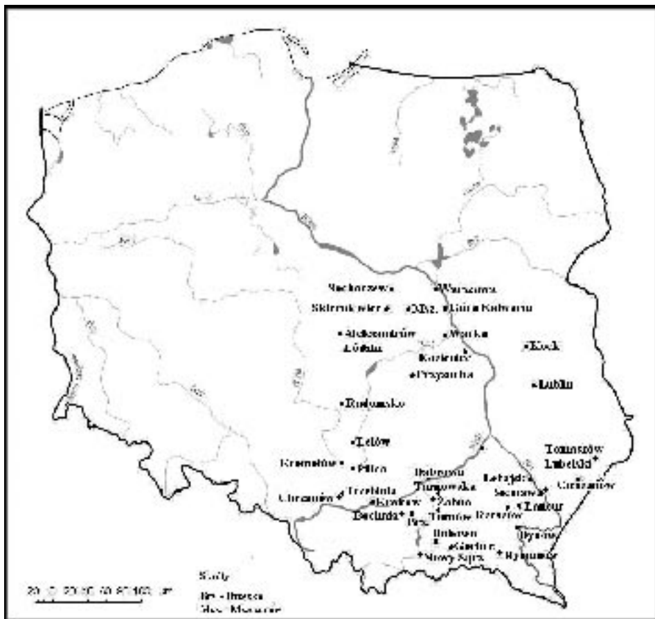
Ryc. 2. Miejscowości w Polsce, w których znajdują się ohele cadyków

Źródło: opracowanie własne na podstawie Żydzi w Polsce. Dzieje i kultura. Leksykon, op. cit., s. 69.