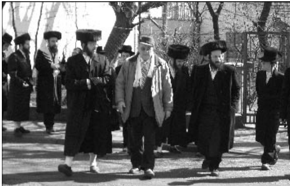
Pielgrzymi przybyli na jorcajt cadyka Elimelecha do Leżajska

Pielgrzymujący do grobów cadyków chasydzi wierzą, że podczas rocznicy śmierci cadyka ( jorcajt ) jego dusza wraca do miejsca spoczynku. Cadyk jako „pośrednik” między Bogiem a człowiekiem jest w stanie zanieść prośby pielgrzymów do Najwyższego. Dlatego też modlitwa nad grobem cadyka w tym dniu jest tak istotna. Pielgrzymka do grobów cadyków, dla znacznej części pielgrzymów przybywających indywidualnie, jest związana nie tylko z jorcajtami , ale również z chęcią odnalezienia grobów rodzinnych oraz dawnych miejsc zamieszkania rodziny. Przyjazdy do Polski także mogą mieć charakter poznawczy. Kilkakrotnie latem w Górze Kalwarii odbywała się jesziwa dla chasydzkich studentów ze Stanów Zjednoczonych i z Izraela. Groby cadyków odwiedzane są też przez grupy żydowskiej młodzieży z Izraela, Stanów Zjednoczonych i krajów europejskich.