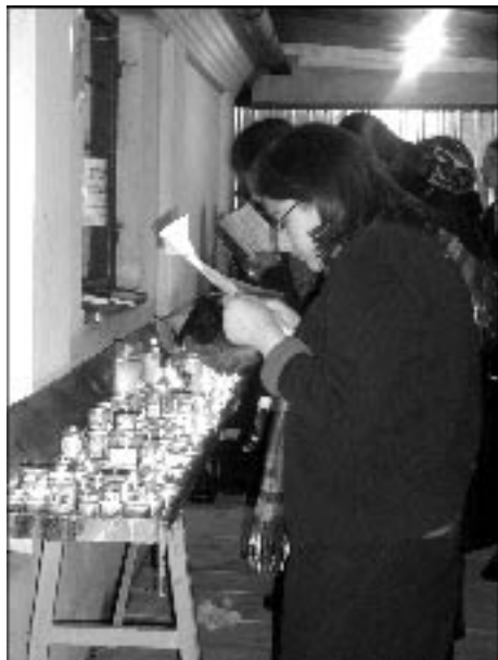
Modlitwa kobiet przy grobie cadyka Elimelecha w Leżajsku