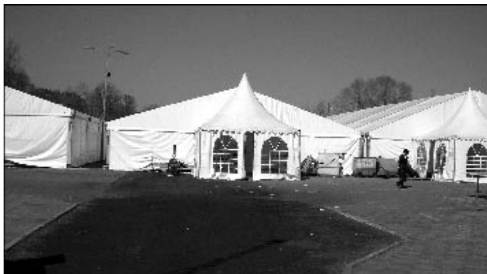
Namioty w Leżajsku