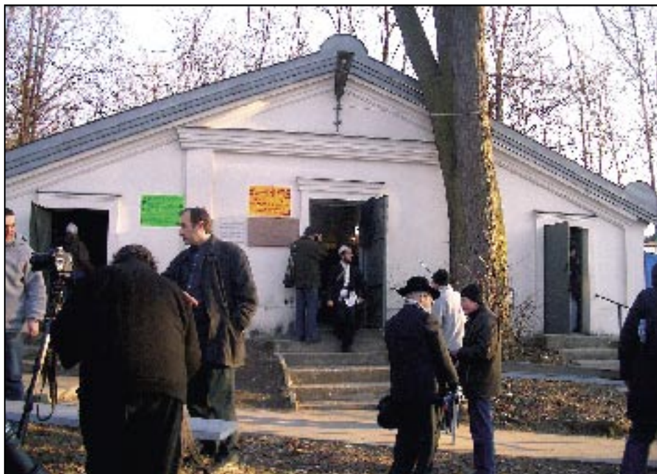
Pielgrzymi przed ohel em cadyka Elimelecha w Leżajsku