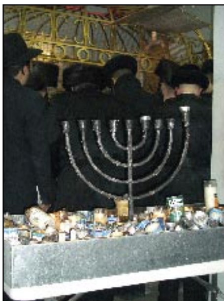
Modlitwa nad grobem cadyka w Leżajsku