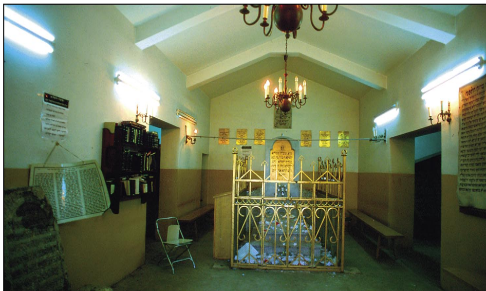
Grób cadyka Elimelecha w Leżajsku