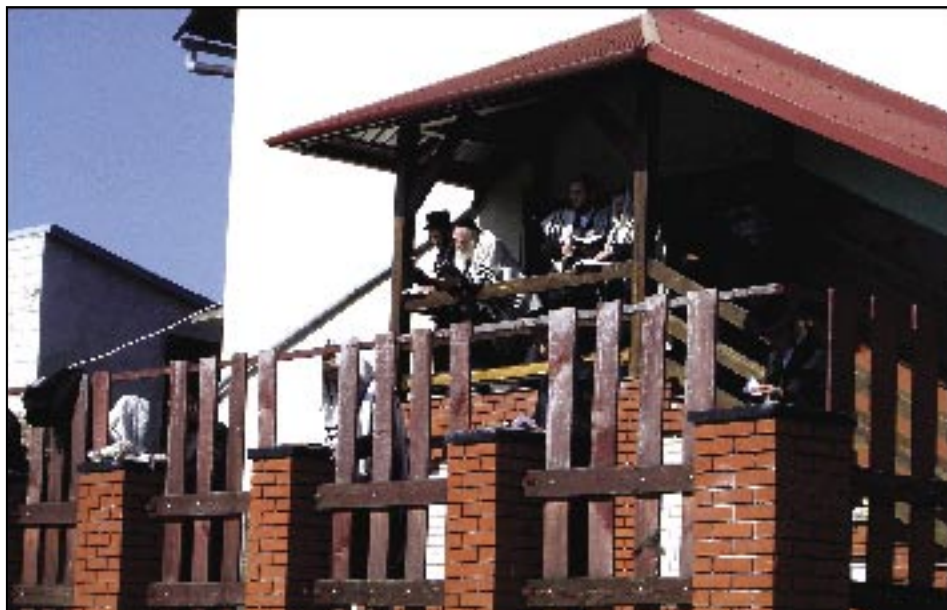
Modlitwa szabasowa w Leżajsku