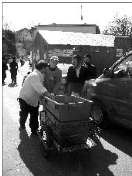
Transport jedzenia z koszernej kuchni do stołówek

Najlepiej zorganizowana jest obsługa pielgrzymów przybywających na jorcajt Elimelecha z Leżajska. W 2002 r., w rocznicę śmierci cadyka, Leżajsk odwiedziło ok. 10 tys. pielgrzymów, jest to największy chasydzki ośrodek pielgrzym-