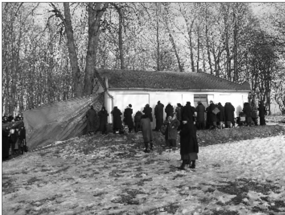
Fot. 1. Modlitwa wokół grobu cadyka