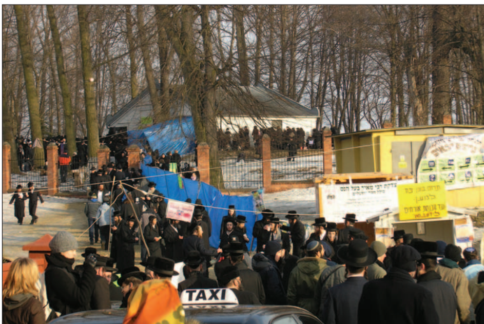
Tłumy pielgrzymów zmierzających na cmentarz