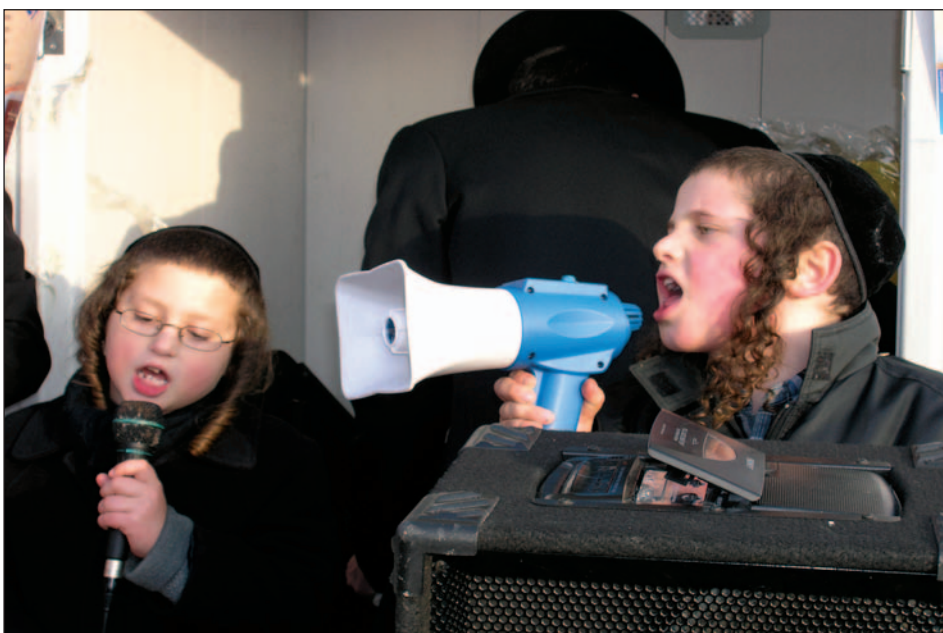
Chasydzkie dzieci zbierające cedakę (datki)