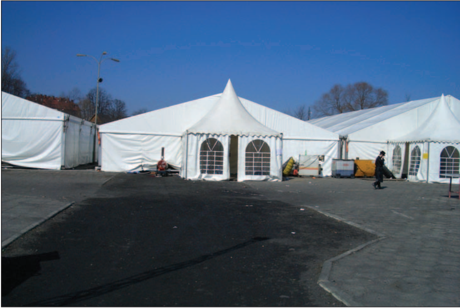
Namioty sypialne w Leżajsku