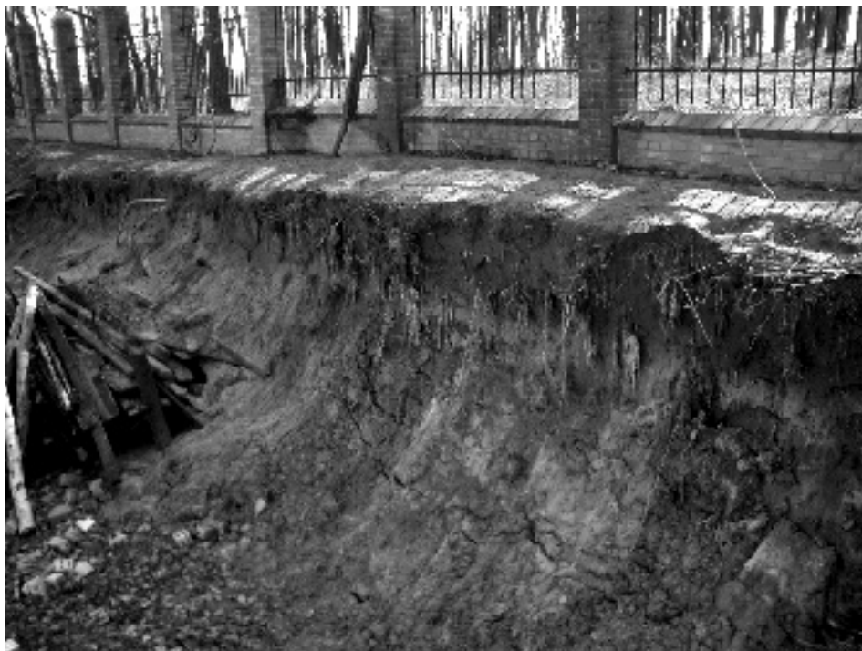
Fot. 2. Podkopywana skarpa przy cmentarzu

w okolicy cmentarza, którzy po godzinie 22.00 proszą straż miejską o interwencję w sprawie zakłócania ciszy nocnej.