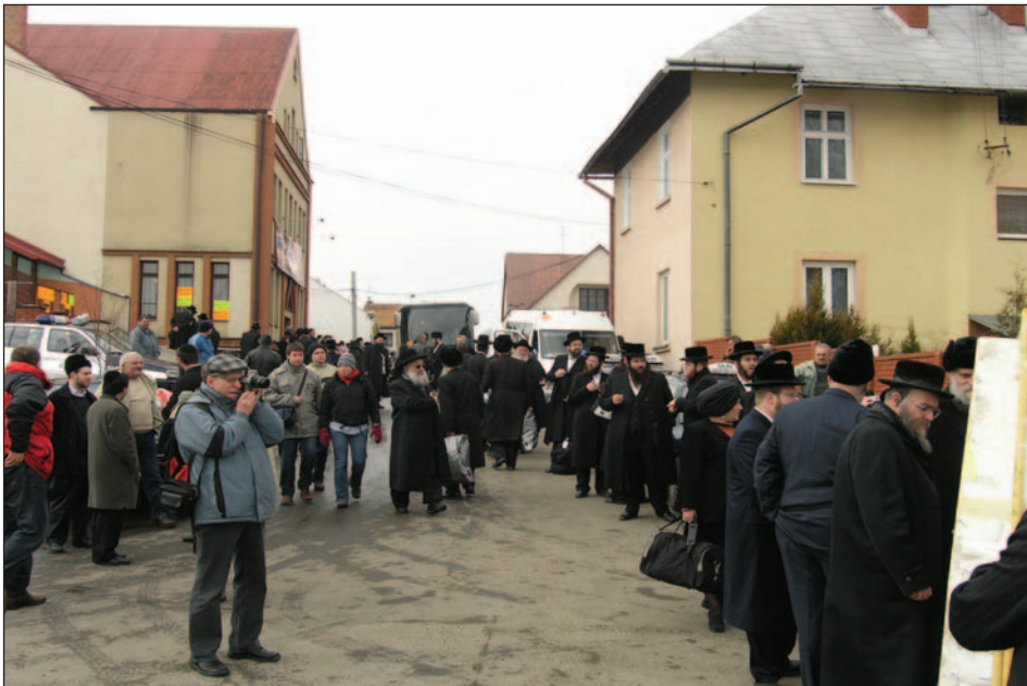
Mieszkańcy miasta i pielgrzymi w Leżajsku