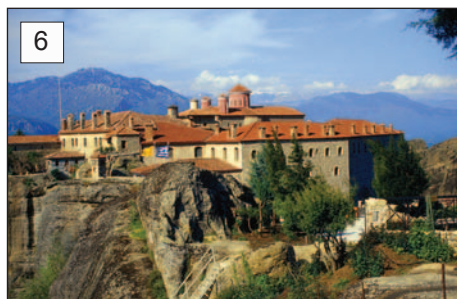
6 Klasztor św. Stefana (Ágios Stéfanos)