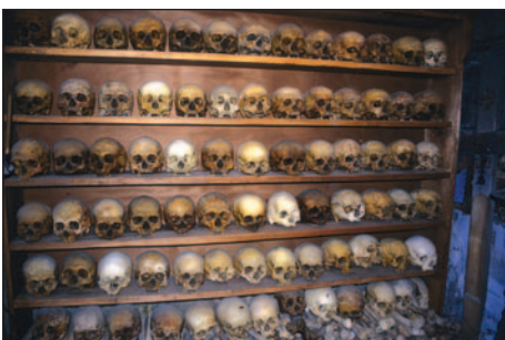
Czaszki zmarłych mnichów w klasztorze Przemienienia Pańskiego