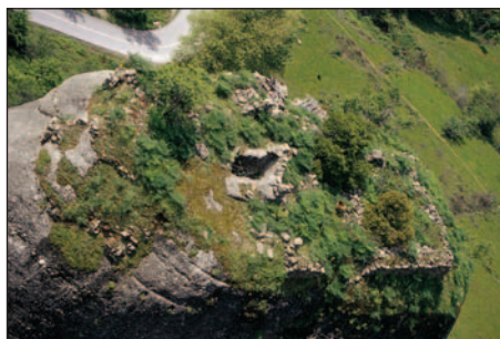
Ruiny klasztoru św. Jana Chrzciciela