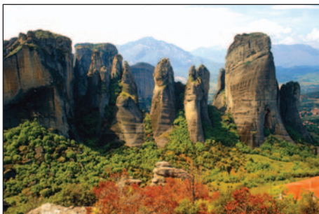
Krajobraz Meteorów