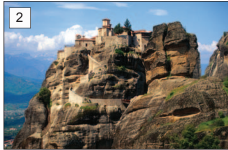
2 Klasztor Warlaam (Varlaám)