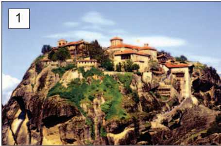
1 Klasztor Przemienienia Pańskiego czyli Wielki Meteoron (Megálon Meteórou)