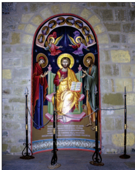
Fresk w klasztorze Warlaam