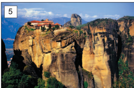
5 Klasztor św. Trójcy (Agías Triádos)