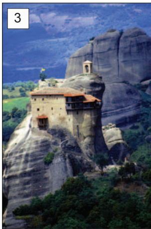
3 Klasztor św. Mikołaja Anapafsa (Agíou Nikoláou Anapavsás)