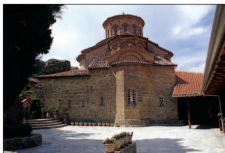
Katholikon w klasztorze Przemienienia Pańskiego (fot. W. Maciejowski)