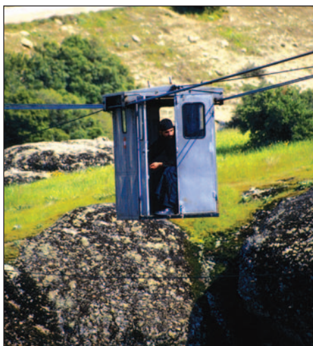
Nowoczesny środek transportu mnichów do klasztoru św. Trójcy