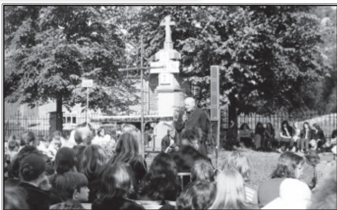
Kardynał Karol Wojtyła na oazowym dniu wspólnoty w Rdzawce (lata 70. XX w.)