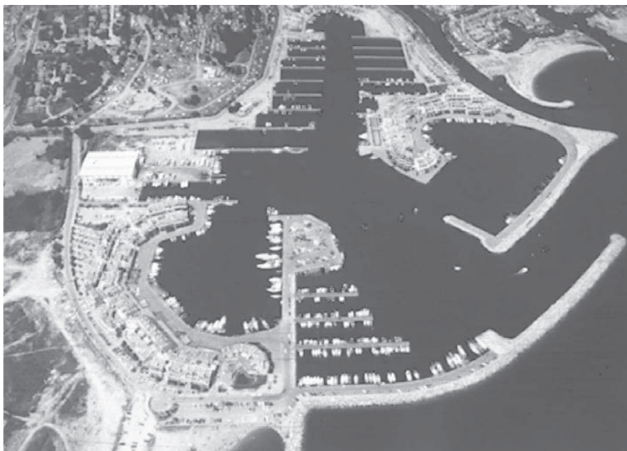
Fot. 10: Marina koło Saint Tropez (Francja).