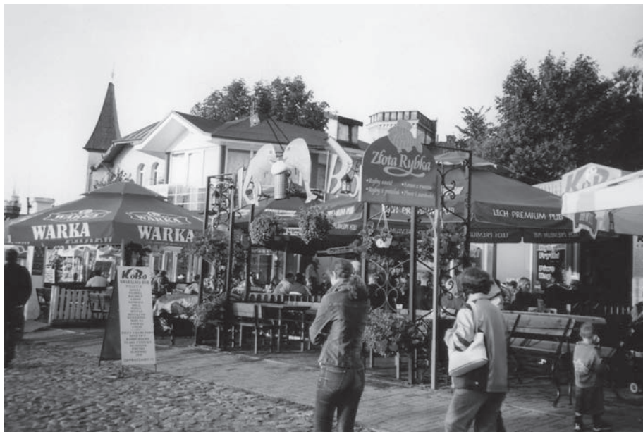
Fot. 12: Chaotyczne zagospodarowanie nabrzeża w Ustce.