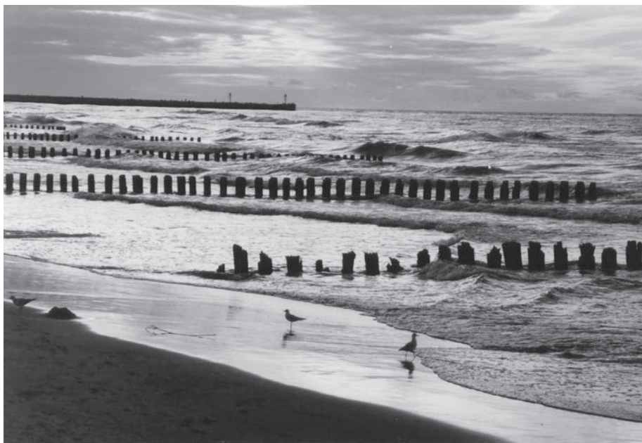
Fot. 6: Wybrzeże Bałtyku w Ustce.