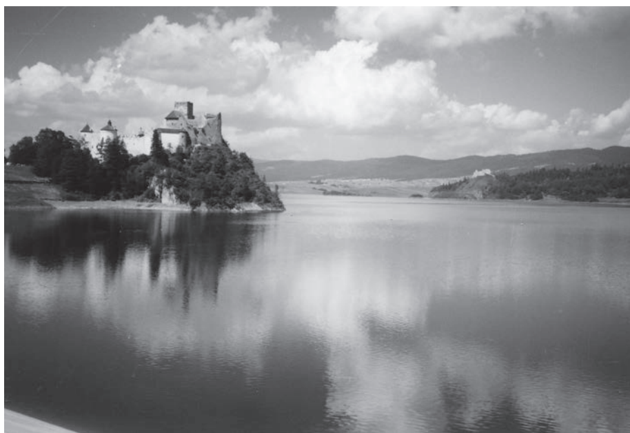
Fot. 3: Zamek Niedzica nad Zalewem Czorszyńskim.