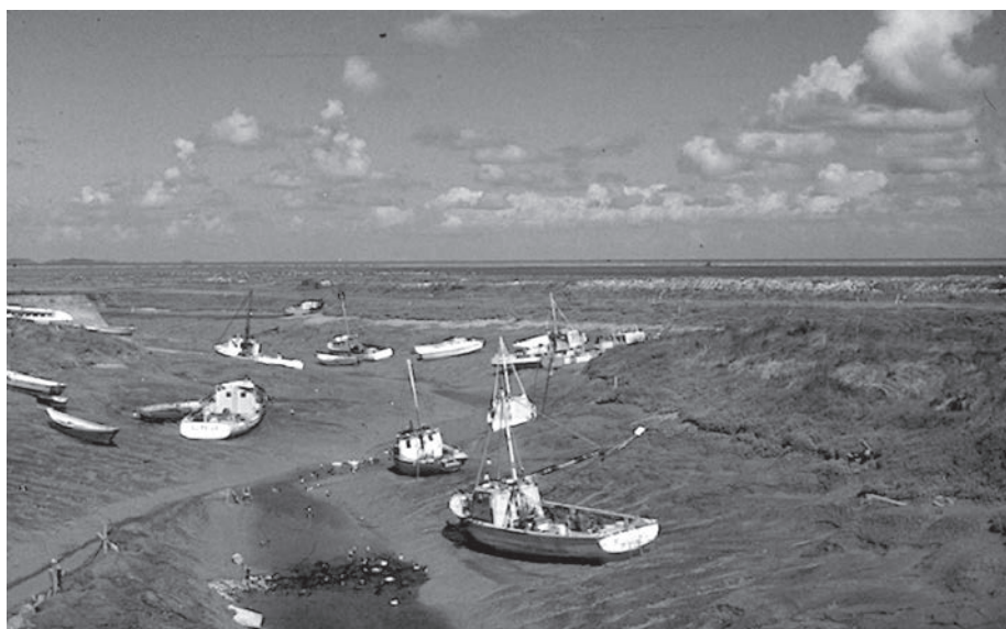
Fot. 7: Odpływ morza w Bretanii (Francja).