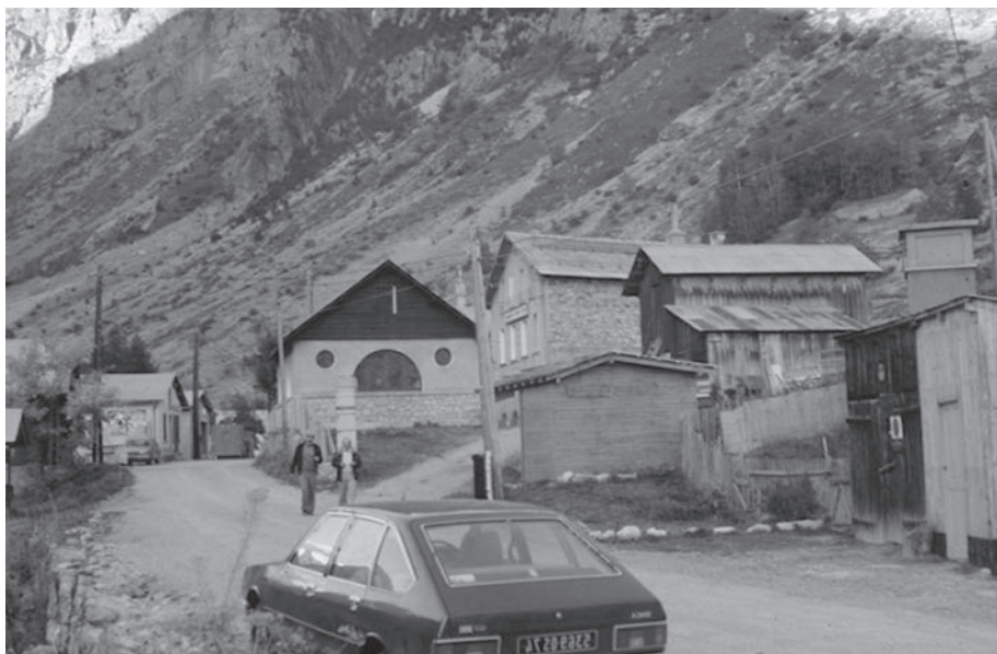
Fot. 11: Wejście do Parku Narodowego Ecrins w rejonie górnej granicy lasu (Francja).