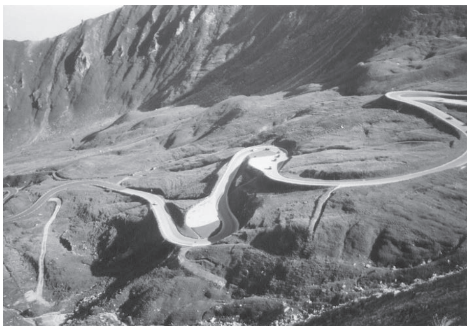
Fot. 8: Droga na Grossglockner (Austria).