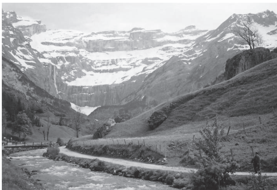
Fot. 4: Cyrk Gavarnie w Pirenejach (Francja).