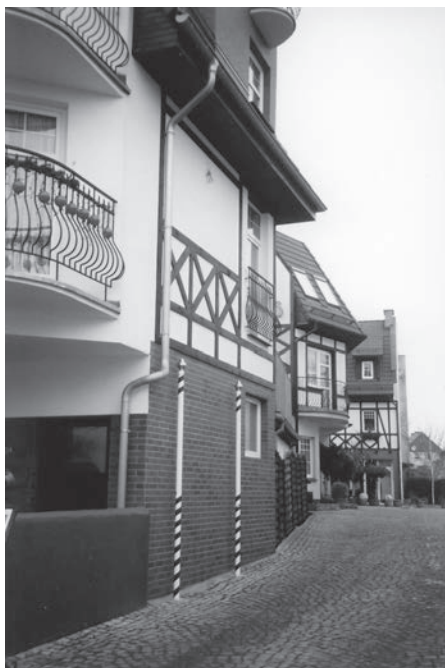
Fot. 13: Harmonijna zabudowa w Ustce (fot. D. Ptaszycka-Jackowska).