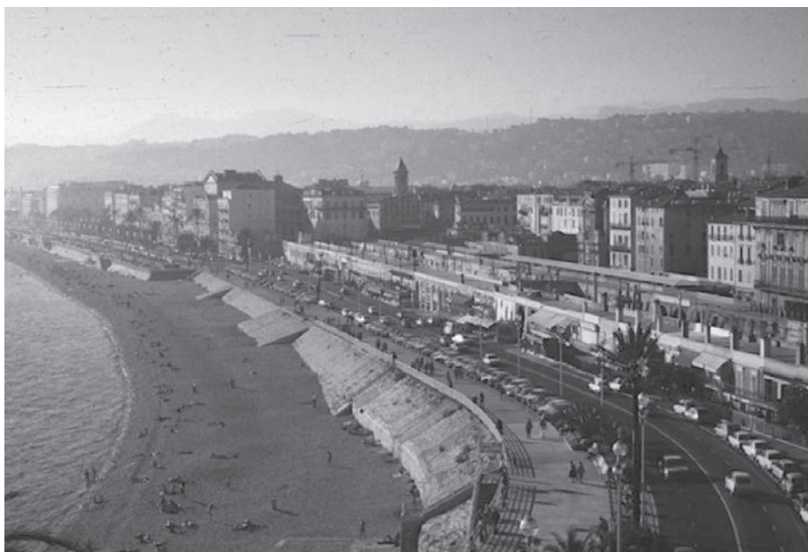
Fot.2: Turystyczna przestrzeń rzeczywista – Nicea (Francja).