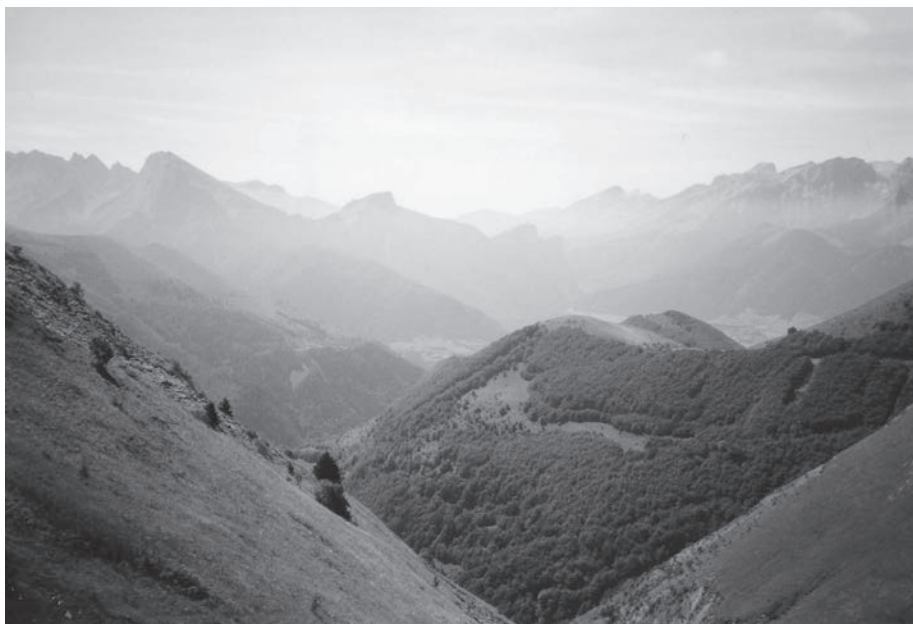
Fot.1: Turystyczna przestrzeń potencjalna w Alpach Francuskich.