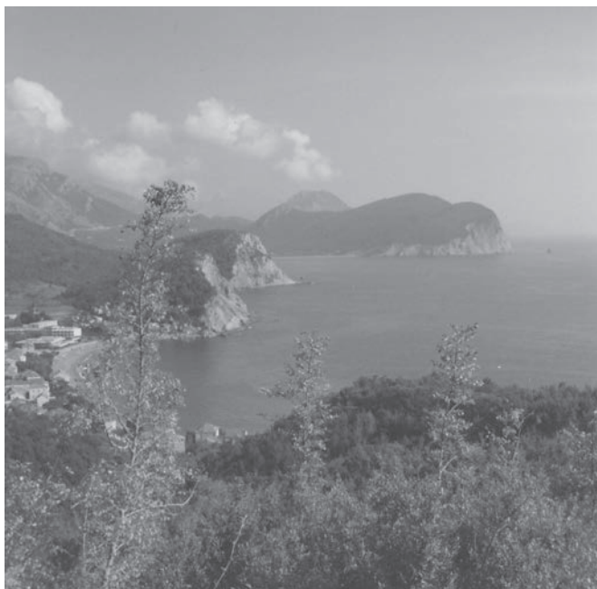
Fot. 5: Wybrzeże Adriatyku w Petrovaču w Czarnogórze.