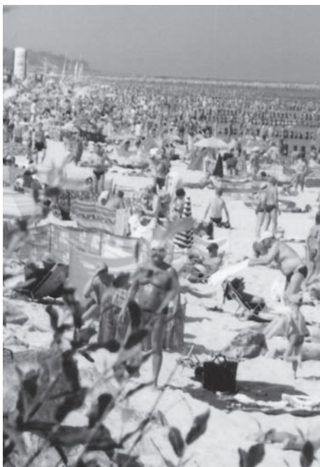
Fot. 14: Przekroczona chłonność plaży w Ustce.