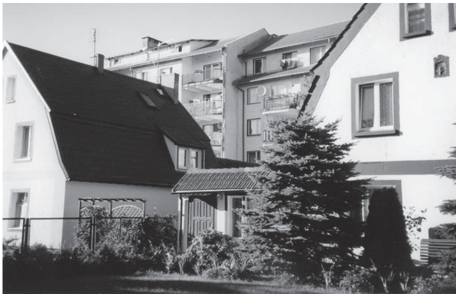
Fot. 15: Nadmierna urbanizacja w Ustce – nowa zabudowa wciska się w zabytkową.