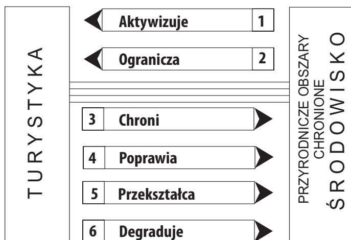
Ryc. 1. Relacje między turystyką a środowiskiem przyrodniczym

Środowisko przyrodnicze – poprzez swoje bogate walory – aktywizuje (1) wiele form turystyki, stwarzając dla nich korzystne warunki w różnych regionach fizyczno-geograficznych, w różnych porach roku (fot. 3, 4, 5, 6).