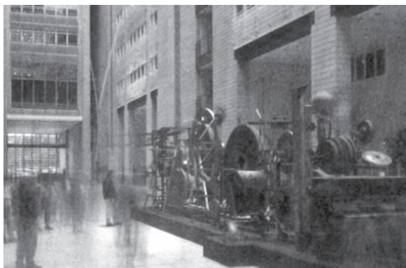
Fot. 3. Przykład adaptacji kotłowni na salę ekspozycyjną