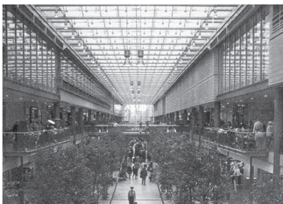
Fot. 4. Przykład adaptacji pompowni na pasaż handlowy