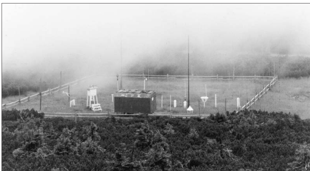
Karkonoska Stacja Meteorologiczna Uniwersytetu Wrocławskiego na Szrenicy