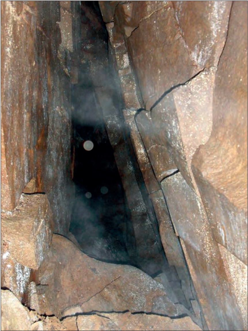
Fot. 3. Jaskinia Krupowa na Okrąglicy