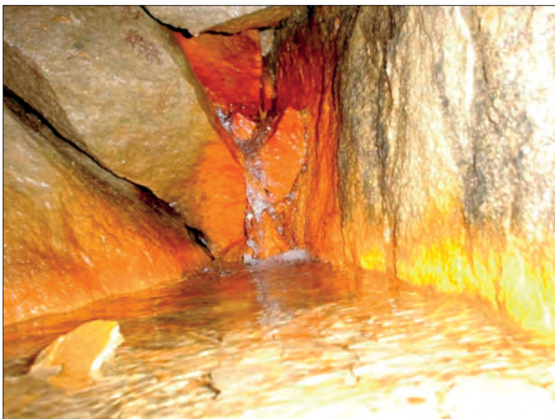
Fot.1. Woda w Jaskini Miecharskiej

Photo 1. Water in Miecharska Cave