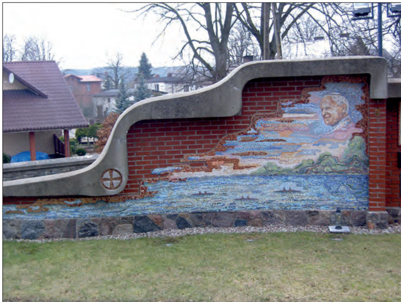
Fot. 4. Ściana wotywna w Gowidlinie – Przystań I