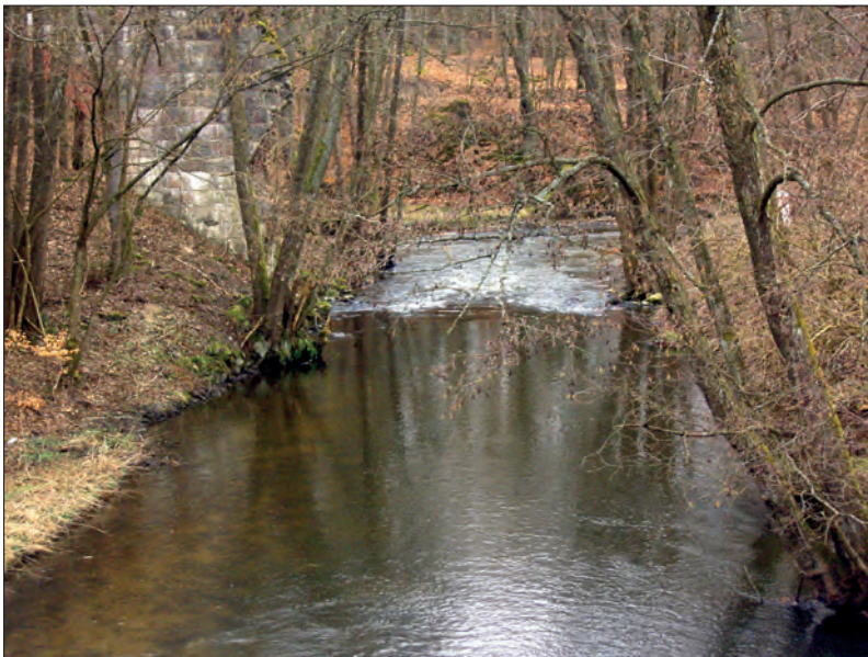
Fot. 2. Soszyca – fragment rzeki Słupi