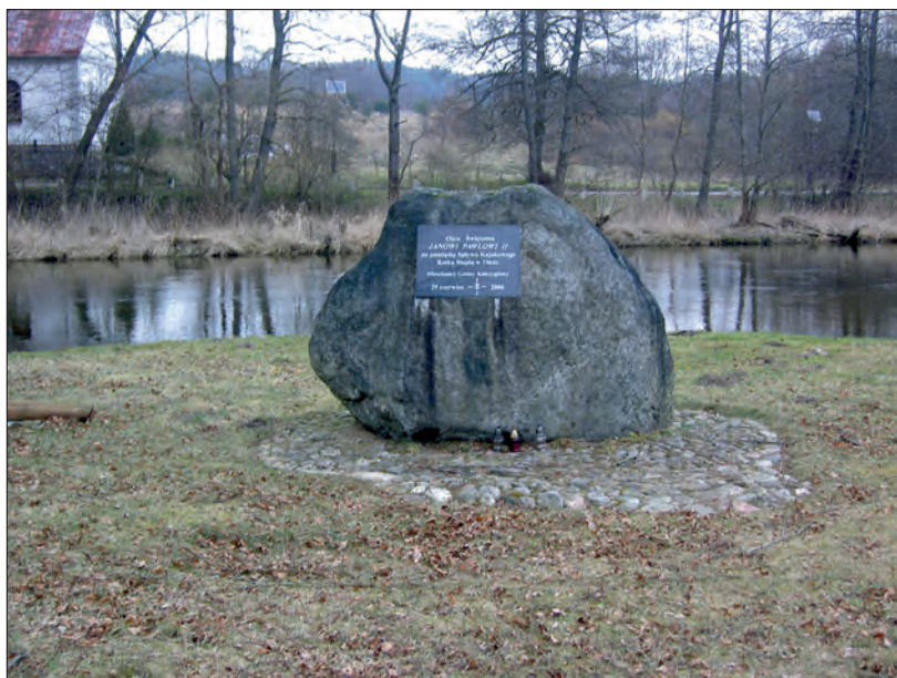
Fot. 5. Obelisk Papieski w Gałęźni Małej (fot. I. Jażewicz)