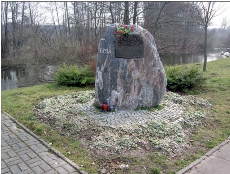
Fot. 1. Obelisk Papieski w Słupsku – Przystań X