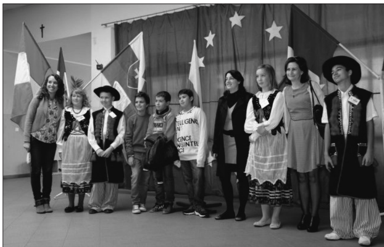
Fot. 1. Wizyta partnerów programu w Krośnie

Photo. 1. Visit of the program partners at Krosno