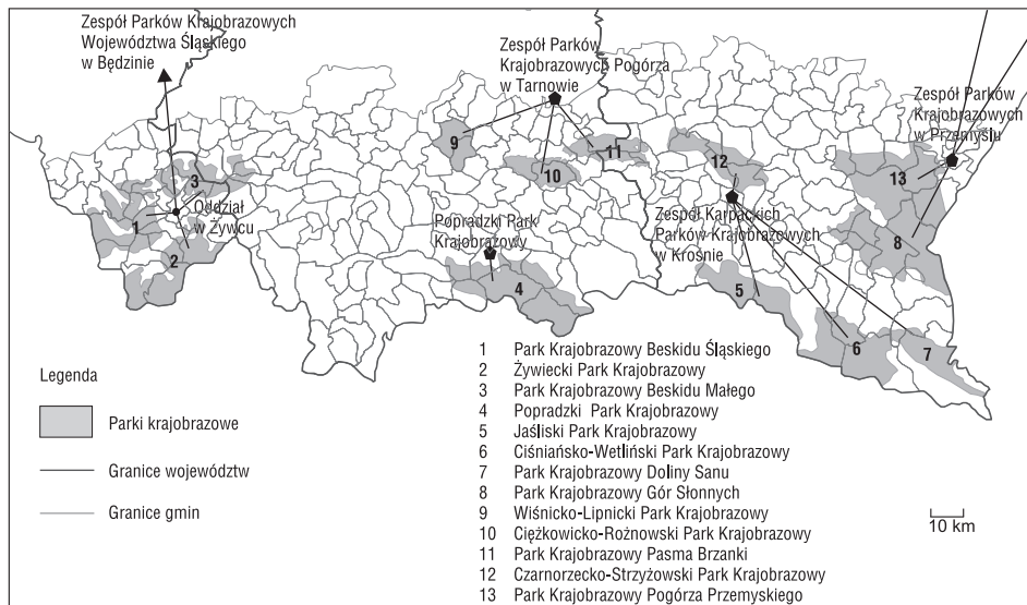
Ryc. 1. System zarządzania karpaccimi parkami krajobrazowymi

Granice parków krajobrazowych wyznaczone zostały w oparciu o kryteria przyrodnicze i z wyjątkiem Wiśnicko-Lipnickiego PK nie pokrywają się z granicami administracyjnymi. W przypadku kilku parków krajobrazowych zauważyć można znaczne rozdrobnienie administracyjne. Z największą liczbą jednostek administracyjnych powiązany jest PK Beskidu Małego, który leży na terenie dwóch województw i aż 15 gmin. Znaczne rozdrobnienie administracyjne cechuje również PK Beskidu Śląskiego – 14 gmin. Najbardziej jednolitymi pod względem administracyjnym są parki Wiśnicko-Lipnicki – 2 gminy, a także Jaśliski i Doliny Sanu – po 3 gminy (tab. 2). Zauważyć jednak należy, że przyczyny nieznacznego rozdrobnienia administracyjnego powyższych parków są odmienne. Niewielki powierzchniowo Wiśnicko-Lipnicki PK obejmuje w całości dwie gminy, zaś w przypadku dwóch pozostałych parków – Jaśliskiego i Doliny Sanu, mała liczba jednostek administracyjnych spowodowana jest znaczną powierzchnią gmin.