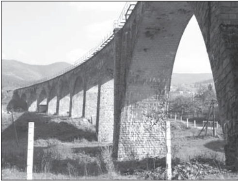
Fot. 5. Wiadukt kolejowy w Worochcie (fot. Ł. Quirini-Popławski, 2004)

Photo 5. Railway viaduct in Vorokhta (by Ł. Quirini-Popławski, 2004)