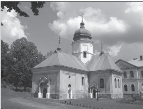
Fot. 6. Ławrów, cerkiew św. Onufrego (pocz. XV w., przebud. XVII–XX w.)

Photo 5. Railway viaduct in Vorokhta