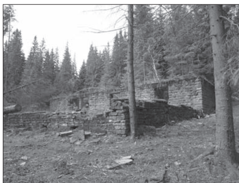
Fot. 4. Ruiny schroniska Związku Harcerstwa Polskiego pod Kostrzycą

Photo 3. Church in Rozluch