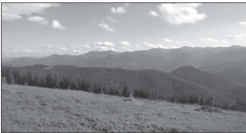
Fot. 2. Widok pasma Czarnohory (część wschodnia) z Kostrzycy

Photo 1. „Dobosh” Rocks in Bubniszcze