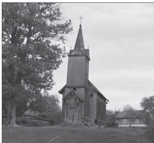
Fot. 3. Kościół w Rozłucz

Rozpoznanie walorów przyrodniczych i antropogenicznych pozwoliło na określenie predyspozycji z punktu widzenia określonych form turystyki na terenie Beskidów Wschodnich. Na podstawie przeprowadzonych badań można wnioskować, iż największą wartość mają walory